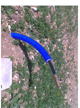
Sortie pour compteur AEP Eau potable