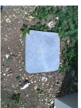
Boîte de branchement FT France télécom